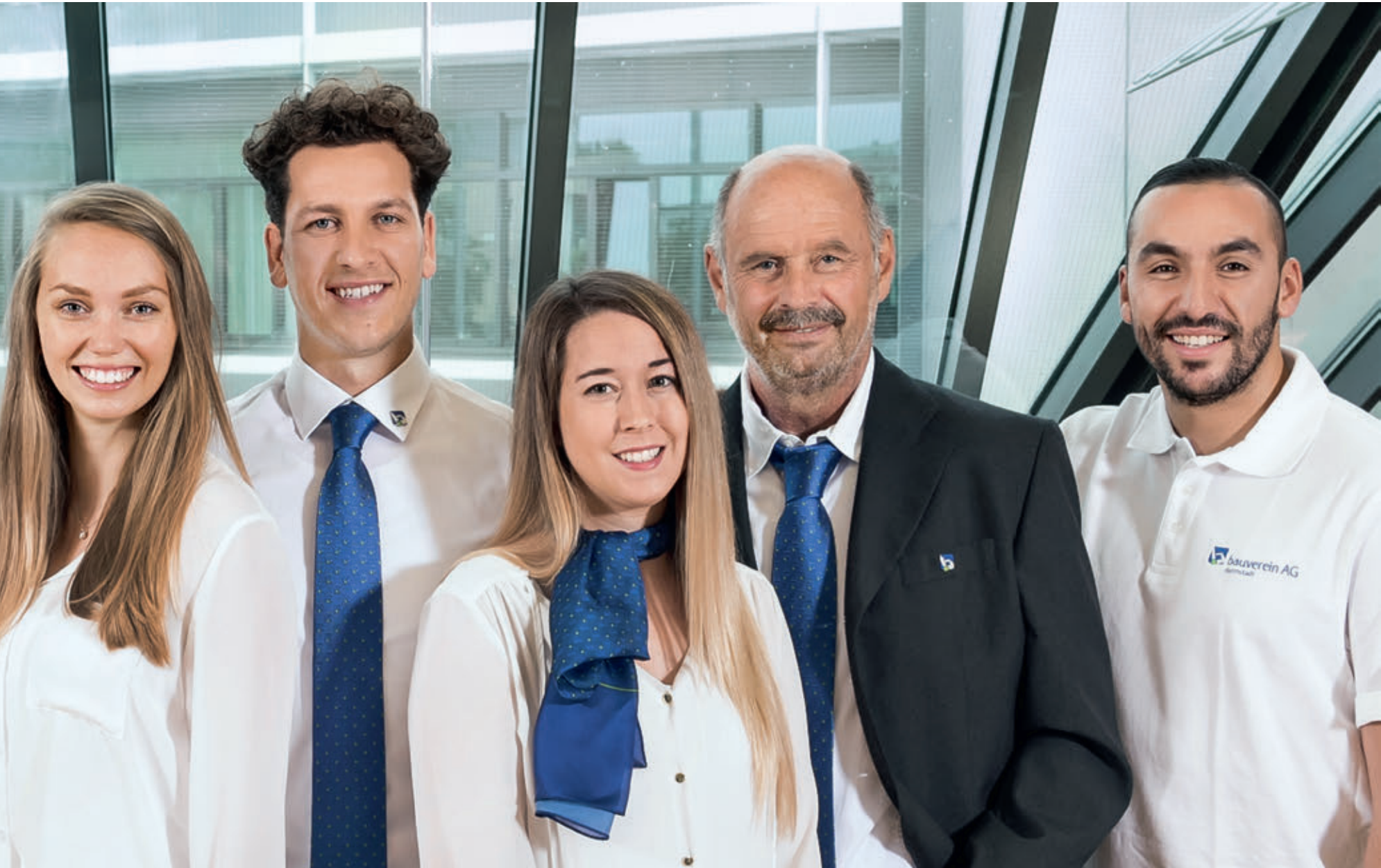
Die Visitenkarte der bauverein AG: Die Neukundenbetreuung ist für alle Neukundinnen und Neukunden erster Ansprechpartner.