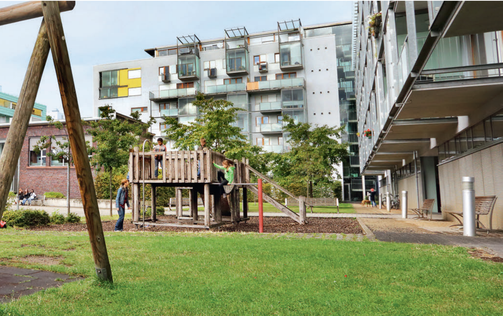
Ein gelungenes Beispiel für Stadtentwicklung: das Ende der 1990er Jahre auf dem Areal des ehemaligen städtischen Schlachthofs errichtete Bürgerparkviertel.