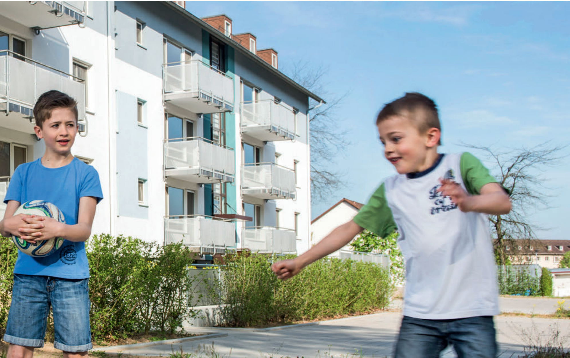
Wohnraum für alle Alters- und Einkommensgruppen: In der Lincoln-Siedlung fühlen sich Familien ebenso zuhause wie Singles, Senioren oder Studenten.